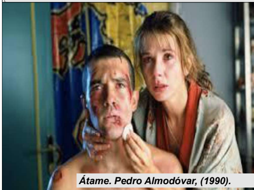
Átame. Pedro Almodóvar, (1990).