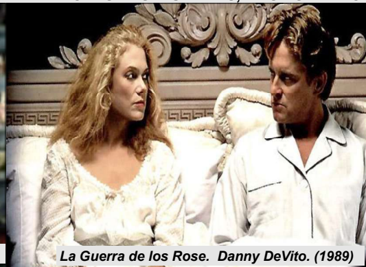
La Guerra de los Rose. Danny DeVito. (1989)