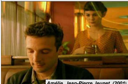
Amélie. Jean-Pierre Jeunet, (2001)