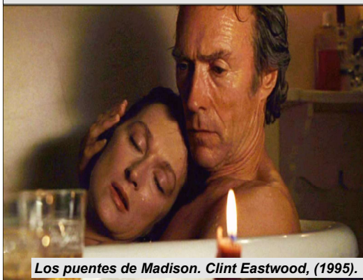
Los puentes de Madison. Clint Eastwood, (1995).