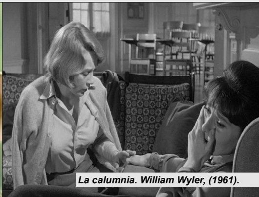
La calumnia. William Wyler, (1961).

Francesca esta casada y es madre de dos hijos, pero con Robert Kincaid ella empieza a sentir otra faceta oculta de su personalidad, la del deseo y la pasión por el otro. Todo el tiempo ella pone a prueba los sentimientos de su amante, con constantes reproches, pero luego es ella quien teme iniciar una relación nueva. A menudo la infidelidad es un modo de compensar dificultades de intimidad que se dan con la pareja habitual o para escenificar escenas traumáticas del pasado.