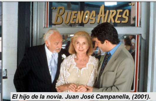
El hijo de la novia. Juan José Campanella, (2001).

Amélie, ha sido hiperprotegida lo que la llevo a ser muy sensible e imaginativa. Al crecer se entretiene satisfaciendo deseos ajenos, jugando a hacer el bien Pero al conocer a Nino, querrá atender sus propias necesidades emocionales. Su vecino el viejo de los huesos de cristal, tal como un terapeuta haría con un paciente, le mostrará el camino de vencer los miedos y empezar a ocuparse de si misma: “Si usted deja pasar esta oportunidad con el tiempo su corazón se irá volviendo seco y frágil como mi esqueleto. ¿Qué espera? Ande, vaya a por él.”