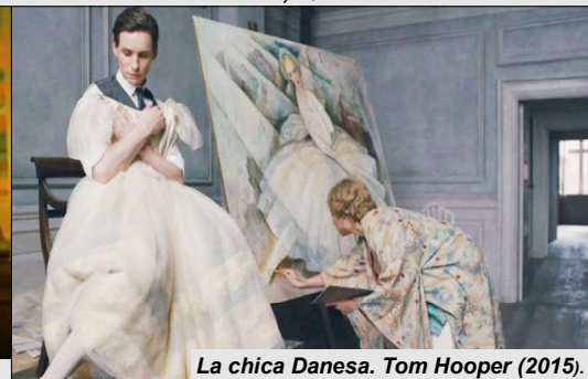
La chica Danesa. Tom Hooper (2015).