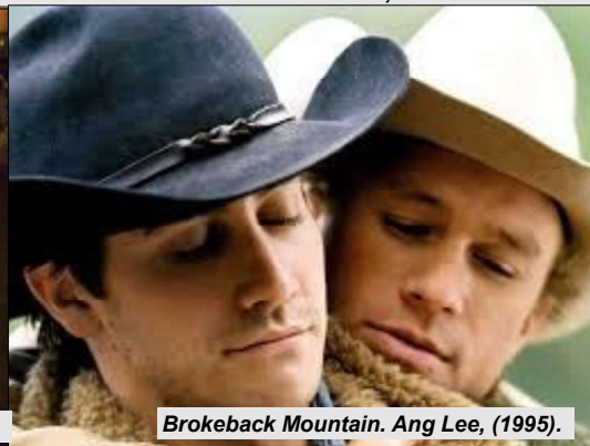
Brokeback Mountain. Ang Lee, (1995).